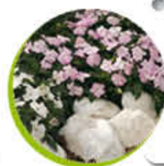
Impatiens de Guinée Belle floraison Annuelle Colorée Gel 0°C