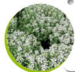
Thym Aromatique Vivace Gel -20°C