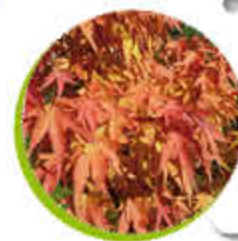
Liquidambar Ornemental Feuillage coloré Gel -15°C