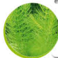
Ceratophyllum demersum Epure l'eau Abri à poissons Gel 0°C