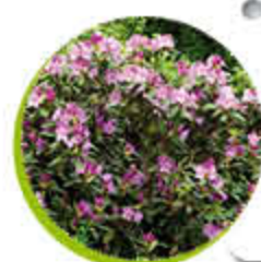
Rhododendron Feuillage persistant Belle floraison Gel -15°C