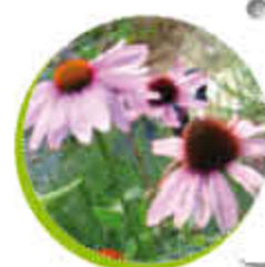
Rudbeckia Vivace Fleurit l'été Médicinal Gel -15°C