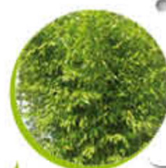
Bambou Très décoratif Plante sculpturale Gel -20°C