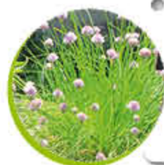
Ciboulette Médicinale Fleurs comestibles Gel -12°C