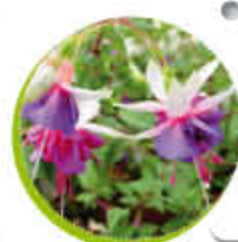
Fuschia Ornemental Port retombant Coloré Vivace Gel -15°C