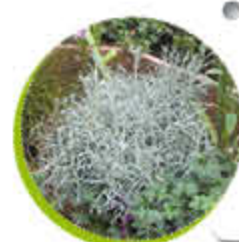
Herbe à Curry Feuillage persistant Aromatique Gel -10°C