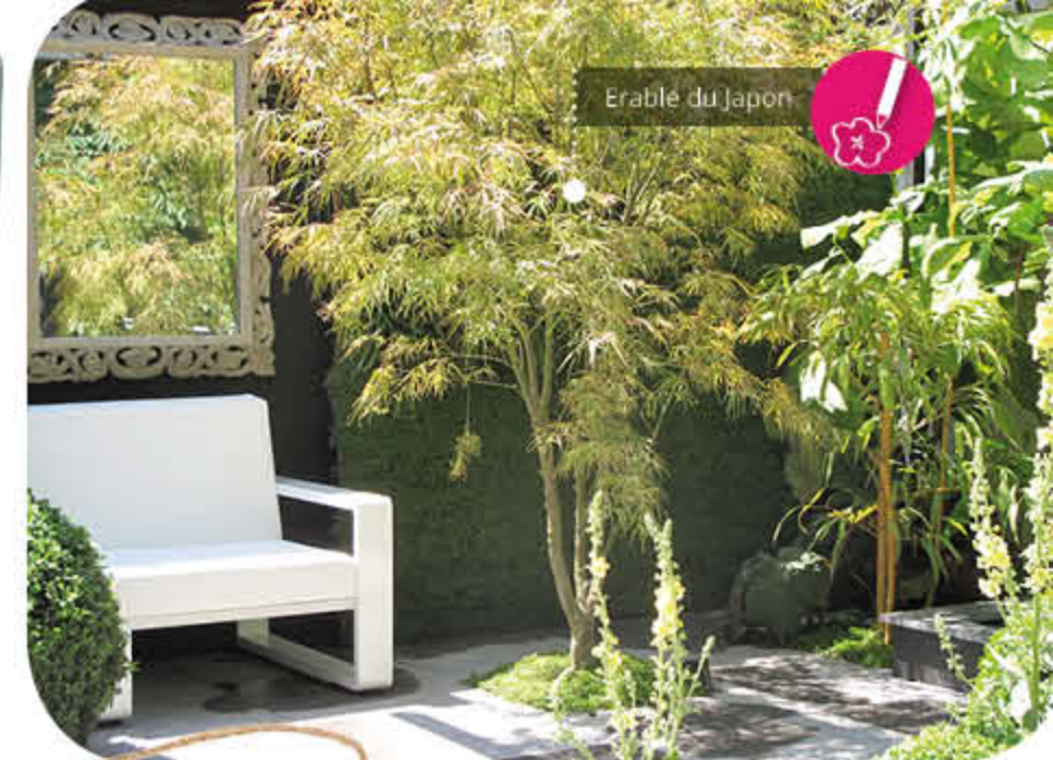
Erable du Japon