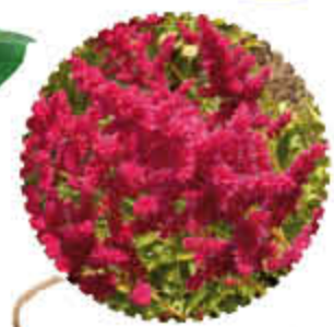
Astilbe de Chine