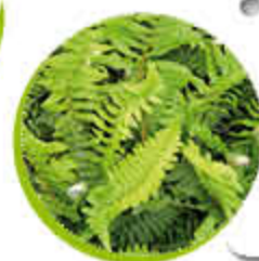
Fougère Ornementale Feuillage persistant Vivace Gel -15°C