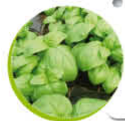
Basilic Médicinal Aromatique Annuel Gel 0°C