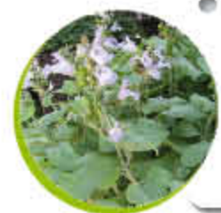
Sauge Ornementale Annuelle Colorée Gel -12°C