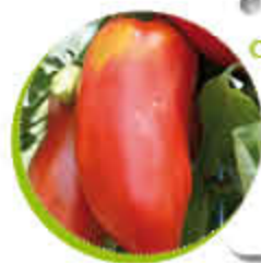
Tomate Cornue des Andes Chair ferme Récolte juin à novembre Gel 0°C