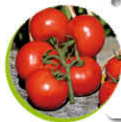
Tomate Premio Fruits savoureux et parfumés Gel 0°C