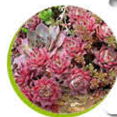
Sédum Ornemental Caduc Fleurit l'été Gel -15°C