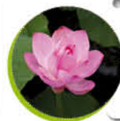
Lotus Vivace Tapissant Gel -5°C

Demandez-moi conseil pour d'autres variétés adaptées à votre jardin.