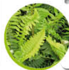
Fougère Ornementale Feuillage persistant Vivace Gel -15°C