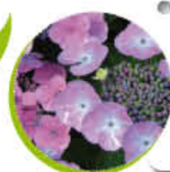
Hortensia Ornemental Feuillage caduc Coloré Gel -15°C