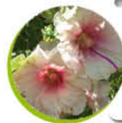
Hibiscus Althea Feuillage caduc Fleurit l'été Gel -15°C