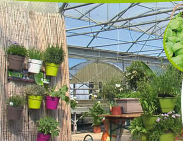
Un potager vertical

Vous souhaitez cacher un mur peu esthétique ? Habillez-le d'une canisse et accrochez-y des pots colorés garnis d'aromatiques.