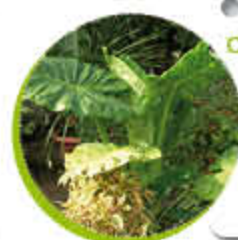
Oreille d'éléphant Feuillage caduc Look exotique Gel -3°C