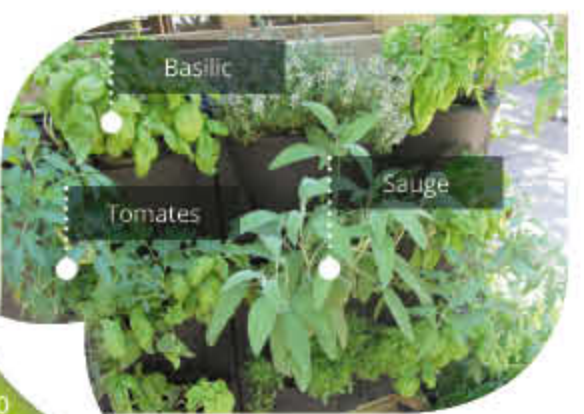
Basilic, Tomates, Sauge