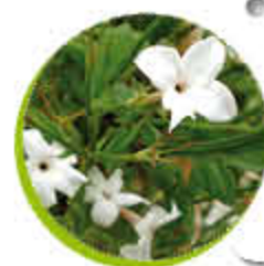
Jasmin Feuillage persistant Grimpant Gel -15°C