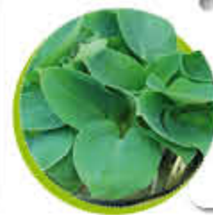
Hosta Feuillage caduc Fleurs en clochettes Gel -15°C