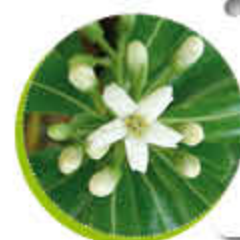
Pittosporum Floraison parfumée Feuillage persistant Gel -12°C