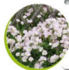
Ciste Feuillage persistant Floraison massive Gel -10°C