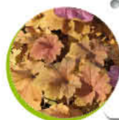
Heuchère «marmelade» Feuillage persistant Colorée Gel -15°C