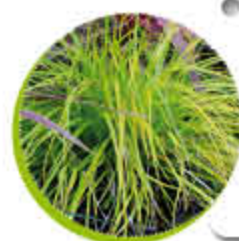
Carex Feuillage caduc Forme étalée Gel -15°C