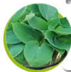
Hosta Feuillage caduc Fleurs en clochettes Gel -15°C