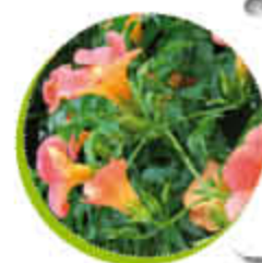
Bignone Ornementale Grimpante Colorée Gel -20°C