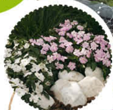
Impatiens de Guinée