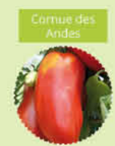
Corne des Andes

Excellente en salade, résistante aux maladies.