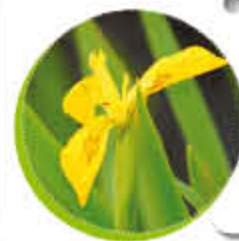
Iris des Marais Vivace Tapissant Gel -15°C