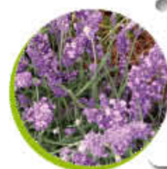
Lavande Feuillage persistant Fleurit l'été Gel -18°C