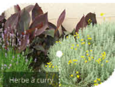
Herbe à curry