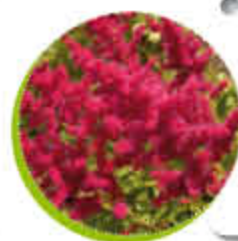
Astilbe de Chine Vivace Idéale en massif Gel -15°C