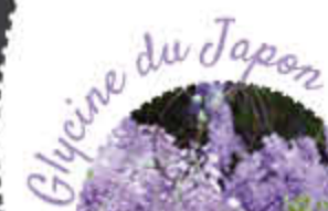
Glycine du Japon