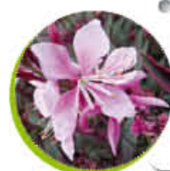
Gaura Florifère Port retombant Gel -10°C