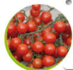
Tomate Sweet baby Productive Saveur douce et sucrée Gel 0°C