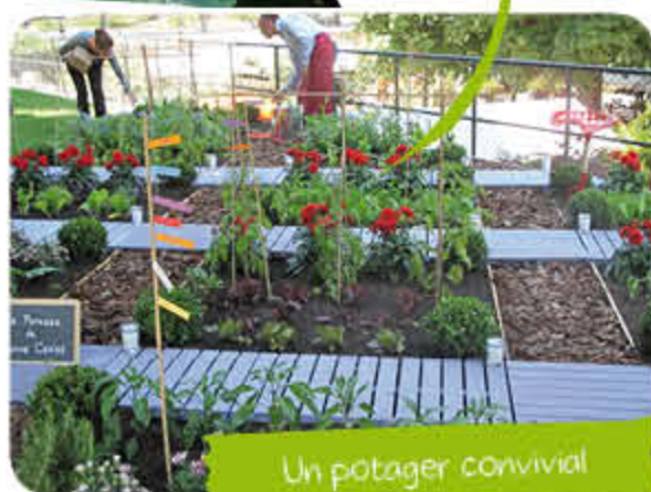
Un potager convivial

Les planches de culture évitent de compacter le sol en marchant dessus.