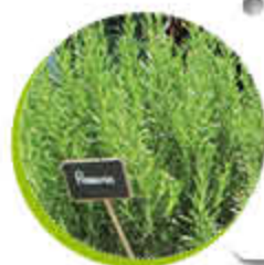
Romarin Médicinal Persistant Aromatique Gel -20°C